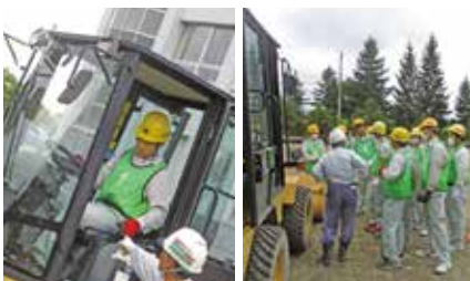
小型建設車両講習