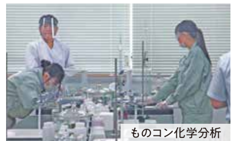
ものコン化学分析