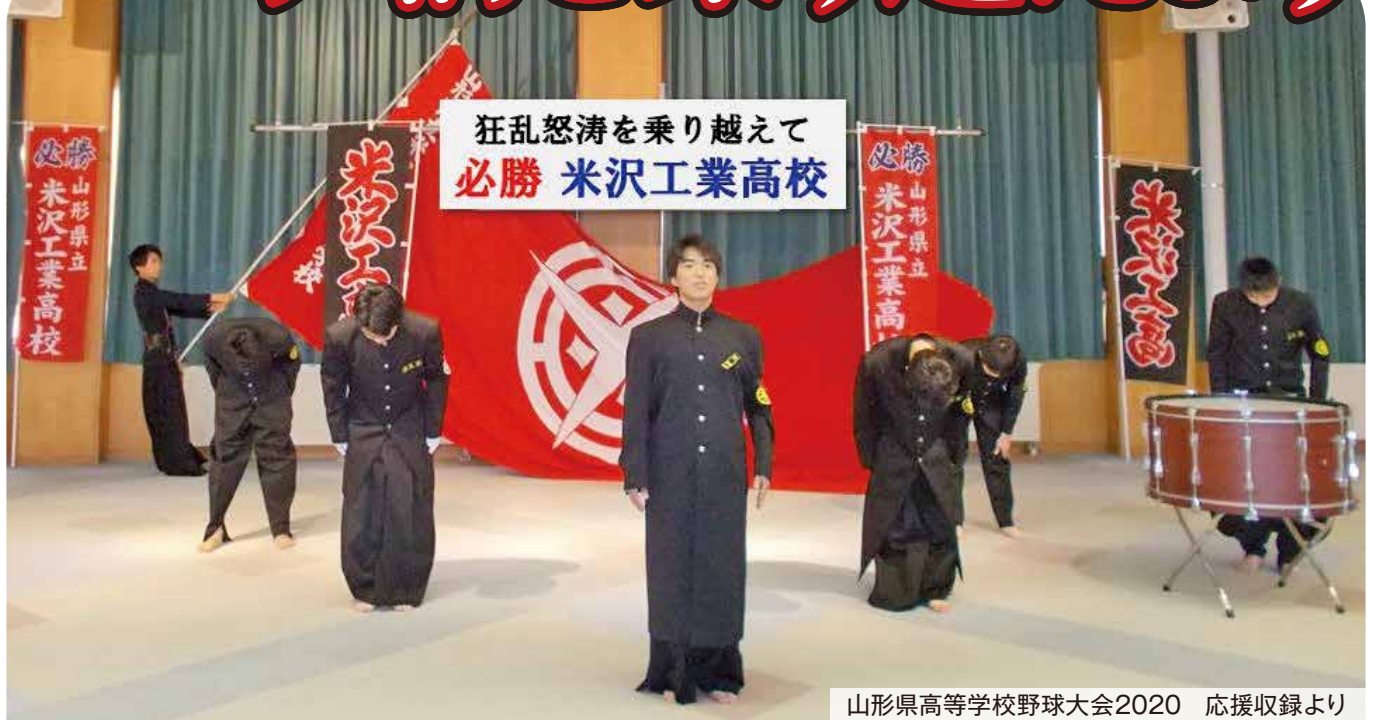
山形県高等学校野球大会2020 応援収録より