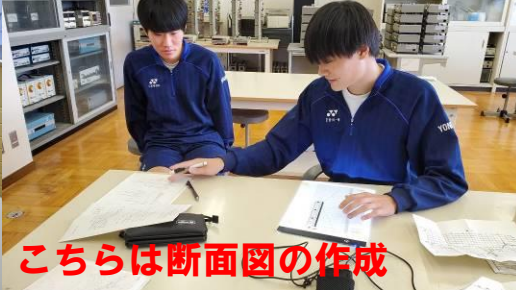
こちらは断面図の作成