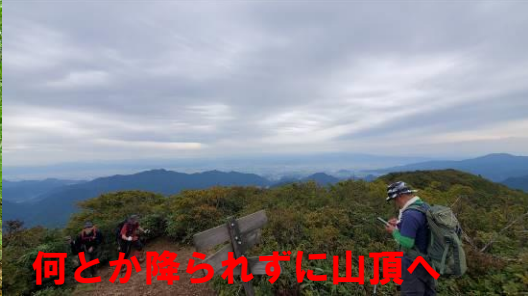
何とか降られずに山頂へ