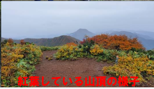
紅葉している山頂の様子