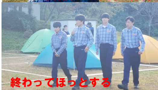
終わってほっとする