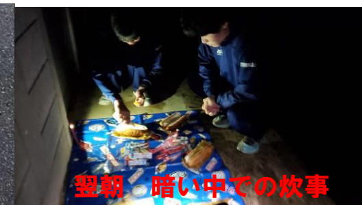
翌朝 暗い中での炊事