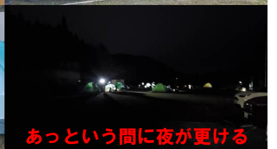
あっという間に夜が更ける