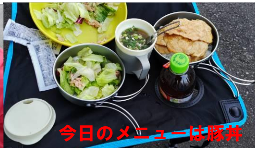
今日のメニューは豚丼