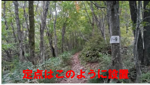
定点はこのように設置