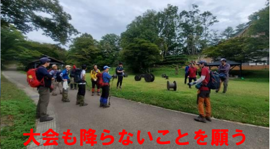
大会も降らないことを願う