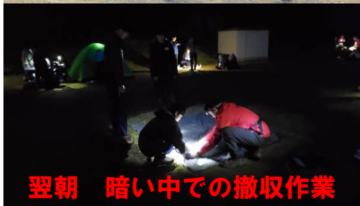
翌朝 暗い中での撤収作業