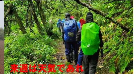
来週は天気であれ