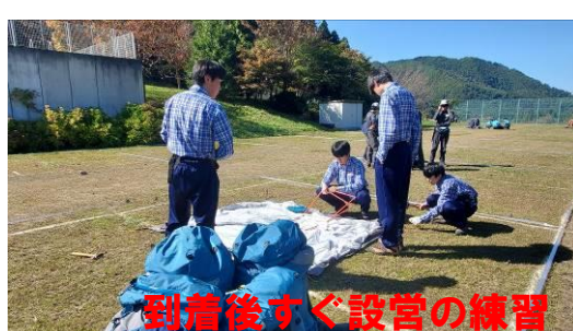
到着後すぐ設営の練習