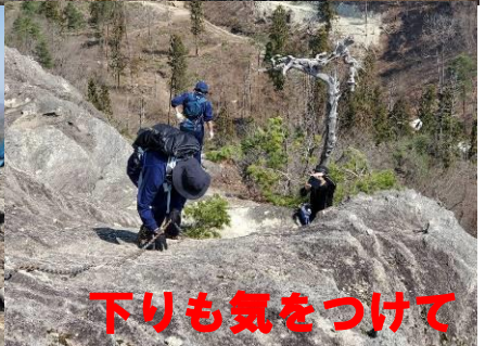
下りも気をつけて