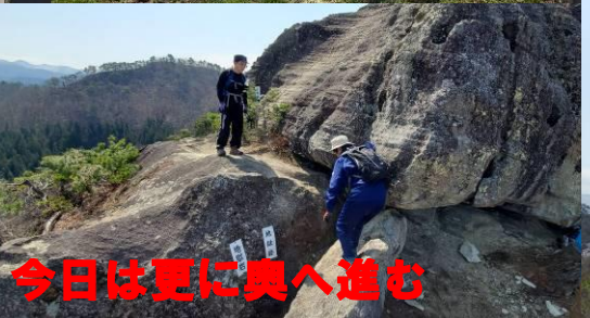
今日は更に奥へ進む