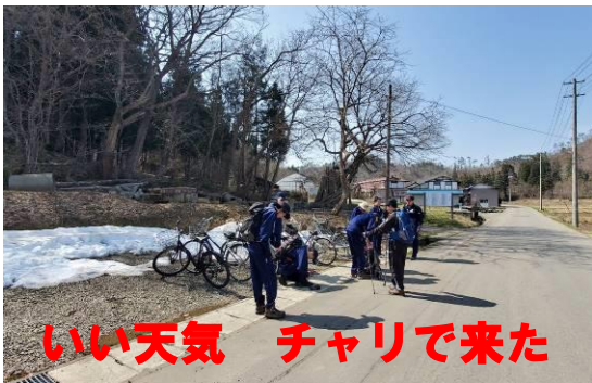
いい天気 チャリで来た