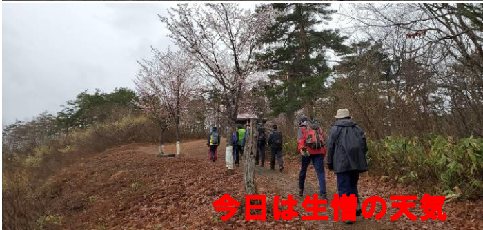
今日は生憎の天気