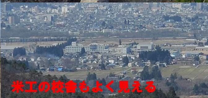
米工の校舎もよく見える