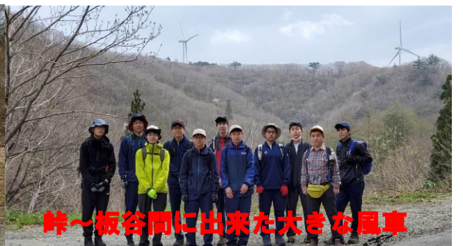
峠～板谷間に出来た大きな風車