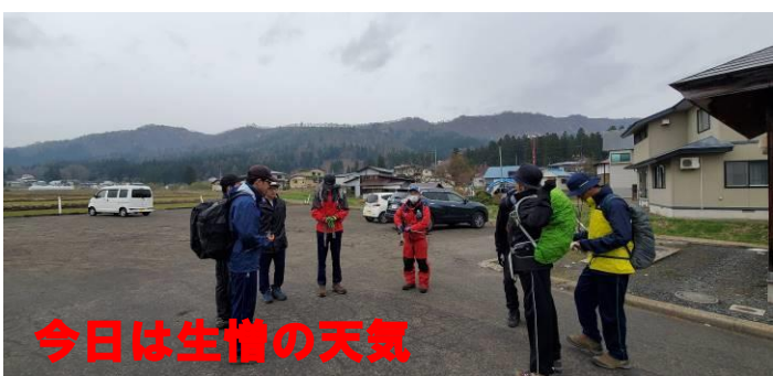
今日は生憎の天気