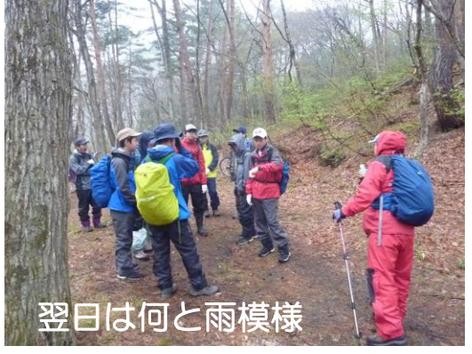
翌日は何と雨模様