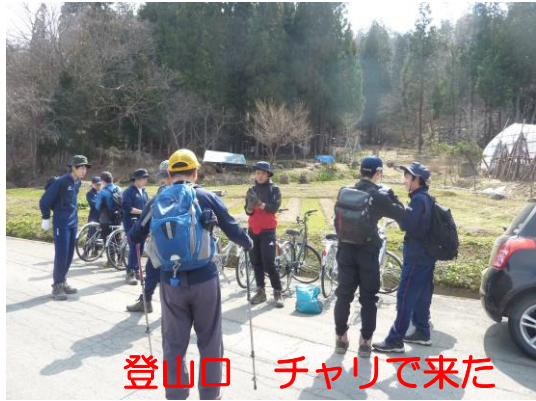
登山口 チャリで来た