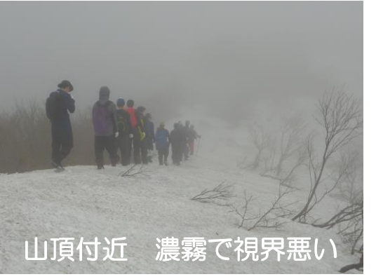
山頂付近 濃霧で視界悪い