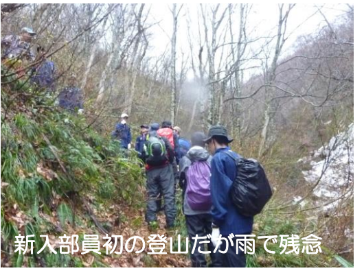
新入部員初の登山だが雨で残念