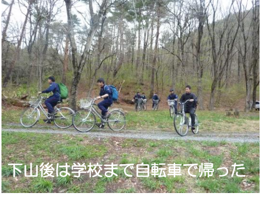
下山後は学校まで自転車で帰った

今年度は2名の新入生と1名の2年生が入部してくれました。心身ともに逞しい「山男」になろう！