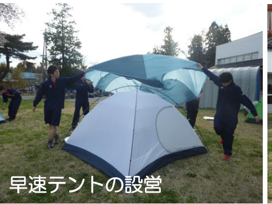
早速テントの設営