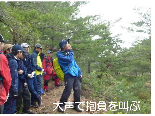
大声で抱負を叫ぶ