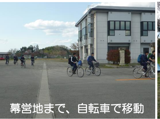
幕営地まで、自転車で移動