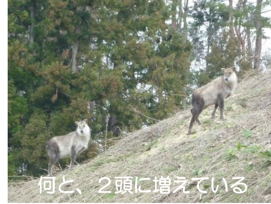
何と、2頭に増えている