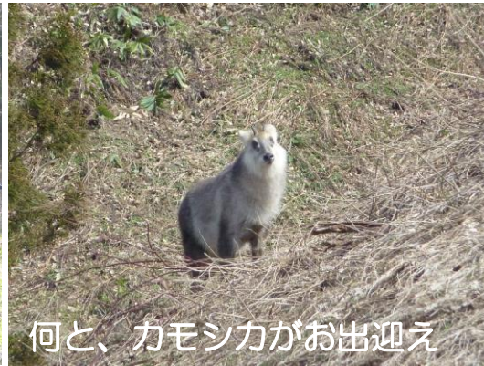
何と、カモシカがお出迎え